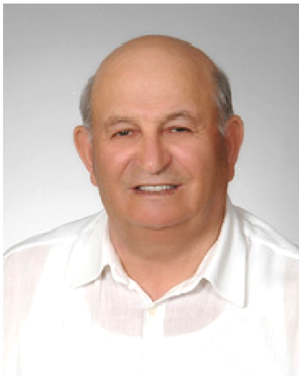
DAVUD YILMAZ 1933-